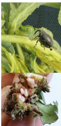
Charançon du bourgeon terminal adulte (en haut) et larves (en bas), qui provoquent la nuisibilité par une absence de tige principale au printemps