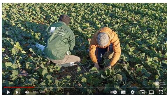
Lien vidéo pesée biomasse Terres Inovia

Avec le maintien de températures plutôt froides, les stades de développement des colzas évoluent peu. La montaison s'engage doucement, avec à ce jour 20 % des parcelles au stade majoritaire C2 (entre-nœud visibles). Ailleurs, la montaison peut être visible sur quelques plantes, mais reste en faible proportion.