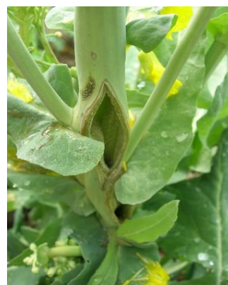
Dégât engendré par le charançon de la tige du colza lors de la ponte

Piège : Nb de charançons tige du colza : ● [0-0] ● [0-4] ● [4-5]