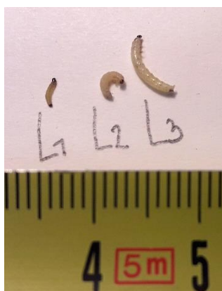
Stades larvaires de grosses altises