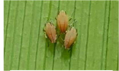
Pucerons Sitobion avenae

Identification : de couleur variable, souvent d'un vert plutôt foncé, parfois brun ou rose jaunâtre, cette espèce mesure environ 2 mm (photo ci-contre). On la distingue par la couleur noire de ces cornicules. En général, les populations importantes s'observent à la base de la tige et sur les premières feuilles. Ce puceron peut monter sur les étages supérieurs dès 8-10 feuilles. A la floraison les populations peuvent être exceptionnellement très importantes.