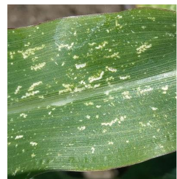
Marques de cicadelles

Observations : 8 parcelles présentent des signalements, de la première à la dixième feuille. Pour une parcelle, les piqûres atteignent la dernière feuille des maïs.