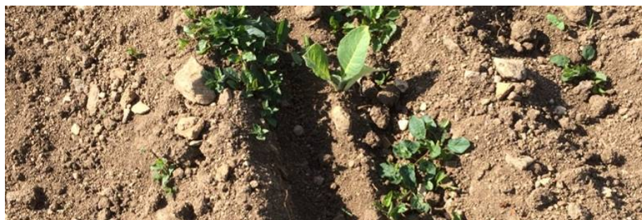
Liserons (à gauche) et Carex (à droite) près de tabac

A la suite des conditions météorologiques orageuse de ces derniers jours, on signale sur quatre secteurs la levée des premières adventices (Morelle noires, amarantes, daturas, renouées, panics, liserons et chénopodes), notamment sur les zones de Cuzorn (47), Griesheim-sur-Souffel (67), Sanvensa (12) et Saint-Ignat (63).