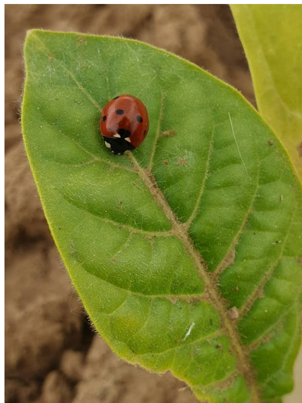
Coccinelle sur feuilles de tabacs

Pour le secteur de Sanvensa (12) on note également la présence de quelques syrphes sur 1 ha et de chrysopes sur 2 ha. Dans la zone de Thuret (63) on aperçoit également des syrphes sur 3 ha.