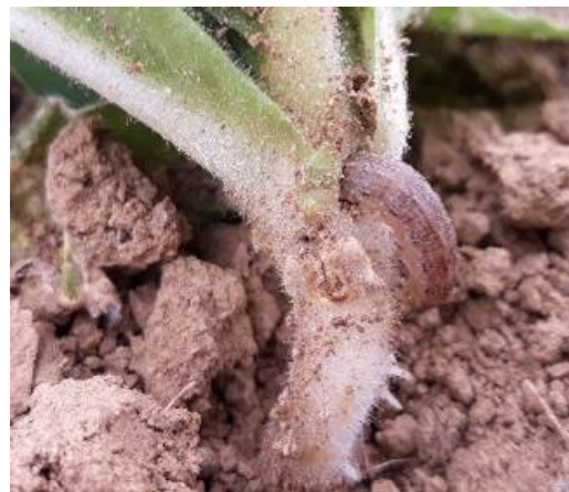
Vers gris sur plant de tabac

Sur la parcelle de référence d'Amuré (79), on observe les traces de quelques corbeaux ou corneilles. En parcelle de tour de plaine, sur le secteur de Thuret (63), on observe des traces de corbeaux sur 3 ha et sur 8 ha pour le secteur de Chemillé (49). On note également la présence de ceux-ci sur le secteur de Vivonne (86) sur une surface de 36 ha.