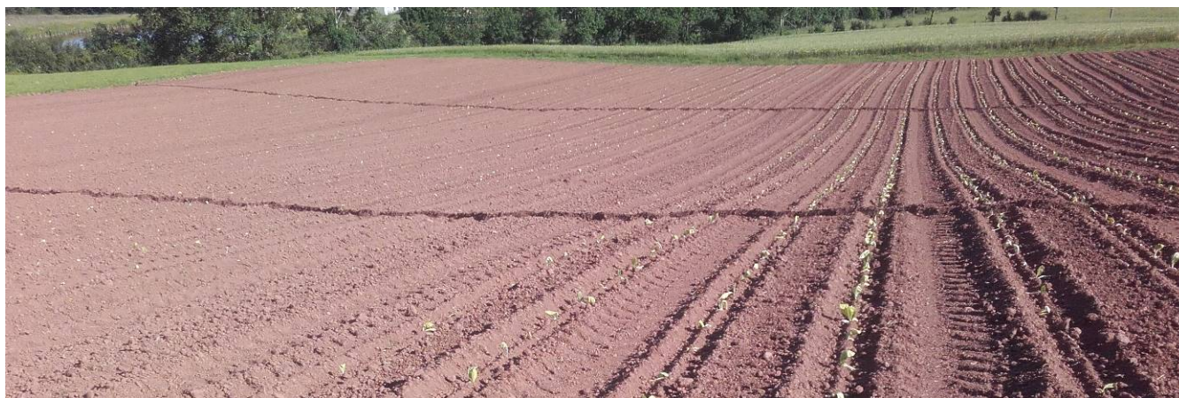
Tabacs plantés

En grande majorité, les plants sont sains et homogènes. Les plantations se sont terminées le 03 juin dans de bonnes conditions, avec une pluviométrie de 30 à 45 mm favorisant une bonne reprise pour les secteurs de Blagnac (33) et Chemillé (49). On observe pour de nombreux secteurs des dégâts de ravageurs du sol (taupins, vers gris etc..) notamment à Sanvensa (12), Hochfelden (67), Chemillé (49), Vivonne (86), Thuret (63) et Beaurepaire (38). Pour le secteur de Hochfelden (67), les plantations sont finies depuis le 4 juin et pour celle du secteur de Vivonne (86), elles prendront fin le 07 juin. On note une apparition rapide de quelques pucerons et punaises dans la zone de Hochfelden (67).