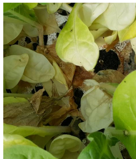
Dégâts de botrytis sur plant de tabac

En tour de plaine, sa présence est signalée sur 1 ha pour les zones de Thuret (63) et Sanvensa (12). Il est constant sur 11 ha pour le secteur de Chemillé (49). Pour Beaurepaire (38), on l'observe sur 15 ha avec une fréquence d'attaque de moins de 20 %. Sur 25 ha, 15 ha présentent des dégâts de moins de 20 % pour la zone de Vivonne (86). Pour le secteur de Hochfelden (67) on observe des dégâts de plus de 20 % sur 51 ha et une fréquence d'attaque de moins de 20 % sur 28 ha.