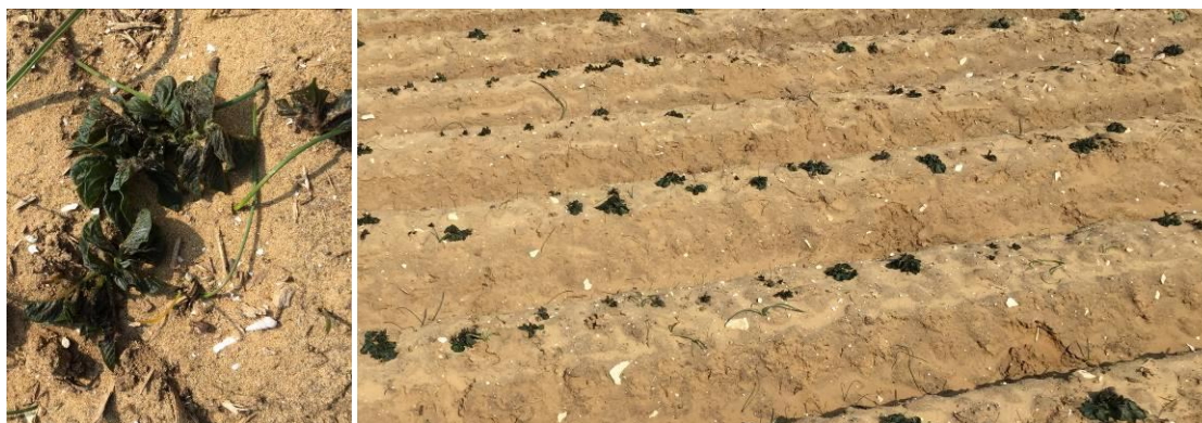
Plants totalement « brûlés » par la gelée

Quelques parcelles plantées fin-février et non bâchées sont levées. Une parcelle particulièrement exposée au vent froid a été très touchée par le récent épisode de gelées. Dans ce cas précis, la totalité des plantes ont été « brûlées ». Depuis, la végétation a repris, mais le retard de production sera notable (10 jours).