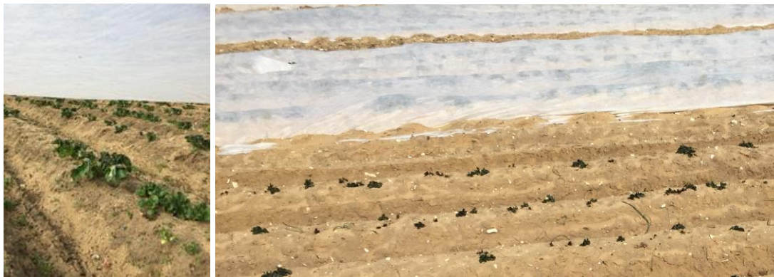
Sous bâches, traces de gel des feuilles en contact – Légère différenciation de stade cultures bâchée / non bâchée

Pour certaines parcelles avec une exposition « peu protégée », on note des traces de gelées sur une partie des feuilles en contact avec la bâche. A ce stade, le retard de culture ne devrait pas être très important.