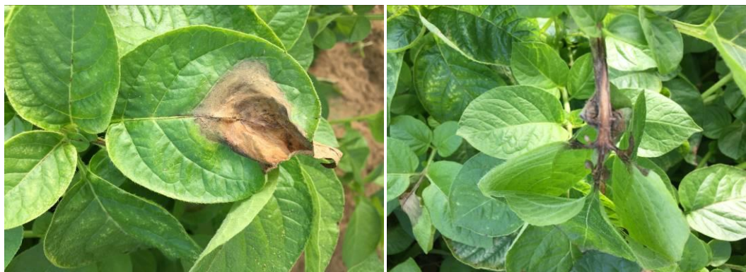
Sous tunnels, taches caractéristiques et atteintes folioles