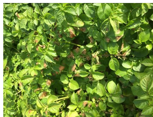
Sous tunnels, foyers de mildiou

Pour ce type de production, les conditions ont été relativement favorables à un développement foliaire et à une tubérisation rapide. On note cependant, un léger retard en comparaison de la campagne 2020 : les premiers arrachages débiteront la semaine prochaine (fin mars).