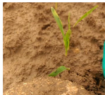
Puceron sur une parcelle de céréales dans le Calvados le 27/10/2020