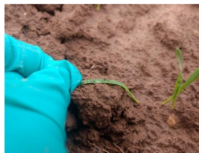
Puceron sur une parcelle de céréales dans le Calvados le 27/10/2020

Les semis précoces exposent les cultures à une plus longue présence de pucerons et s'accompagnent d'une plus faible densité ce qui accroît le risque. Les parcelles abritées, situées en bordure de bois, de haies, ou à proximité de repousses de céréales sont généralement les plus concernées. Un automne doux favorise également l'activité de ce ravageur.