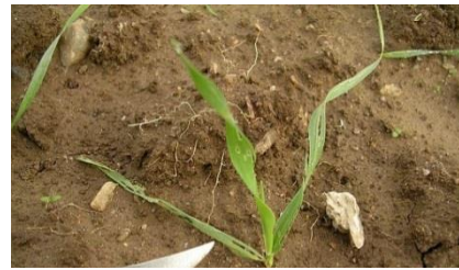
Plantules effilochées par les limaces

Les céréales sont sensibles aux limaces de la levée jusqu'au stade 3-4 feuilles. Les situations les plus à risque concernent les parcelles argileuses, motteuses ou avec des résidus de culture abondants.