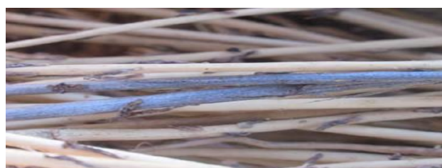
Photo : Les symptômes en cours de rouissage correspondent à l'apparition de microsclérotés sur les pailles leur donnant une couleur bleu métallique