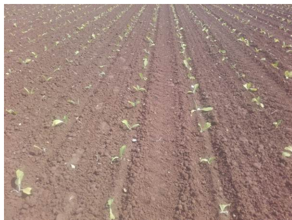
Tabacs plantés - (Crédit Photo : D. SAUREL – Midi Tabac)

Les surfaces plantées varient d'un secteur à l'autre et les conditions climatiques ont retardé la mise en place des plants en plein champ. Notamment à Saint-Sylvestre-sur-Lot (47) où l'on note que 30% des semis de Burley sont plantés avec un retard dû à des précipitations allant de 30 à 70 mm. Malgré ce retard, les secteurs de Proissans (24) et Saint-Sylvestre-sur-Lot (47) sont à 50 % de plantation des Virginie plantés à ce jour. Pour le secteur de Beaucaire (32) les surfaces plantées à 20 % de Virginie ont été retardées suite à une forte pluviométrie. Les secteurs de Pujo (65), Vivonne (86), Tonneins (47), Auvergne (63) et Sénestis (47) sont eux entre à 30 % et 40 % de plantation qui se poursuivra la semaine prochaine.