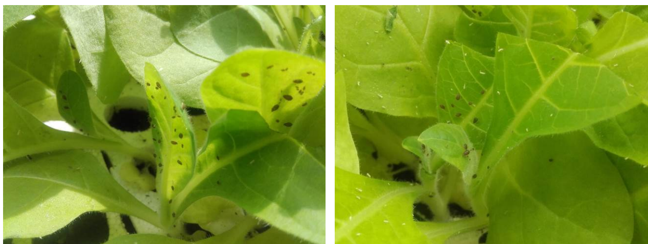
Pucerons sur semis de tabac

Pour le tour de plaine ils sont beaucoup plus présents notamment sur le secteur de Pujo (65) avec des symptômes visibles sur 20 ha. Des foyers de pucerons sont également très présents sur 6 ha dans le secteur de Souillac (46) et sur 8 ha pour le secteur de Beaucaire (32). Sur une dizaine d'hectares, ils sont signalés dans les secteurs de Vivonne (86) et d'Auvergne (63). Des traces de pucerons ailés ont été relevées sur presque la totalité des parcelles plantées dans le secteur du Loivre (51) sur 75 ha. On note une légère pression sur Proissans (24) et Sanvensa (12) ou il a été légèrement observé sur quelques hectares.