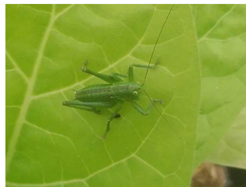
Sauterelle sur feuille de tabac

Les corbeaux ont aussi été aperçus sur le Loivre (51) en tour de plaine où des dégâts de moins de 20 % sont signalés sur 9 ha. En parcelle tour de plaine, on observe également la première apparition de taupins sur 3 ha pour la zone de Saint-Sylvestre-sur-Lot (47). Enfin quelques sauterelles ont été observées sur le secteur de Sanvensa (12).