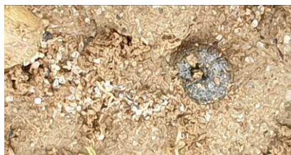
Larve de vers gris et dégâts de vers gris - (Crédit Photos : N. BARRET – TGA)