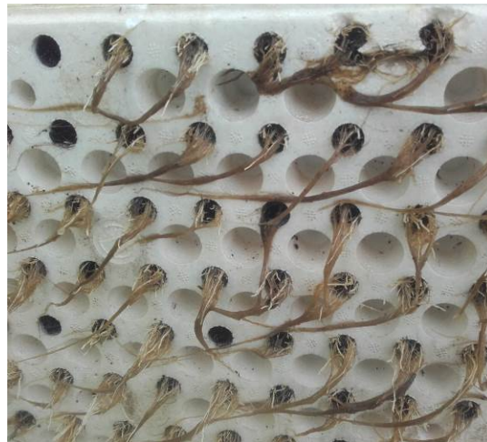
Dégâts d'olpidium sur les racines des semis de tabac (à gauche et droite)