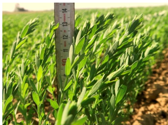
Photo : Claude GAZET – CA 59-62 : Parcelle de lin à 10 cm à Sebourg (59)