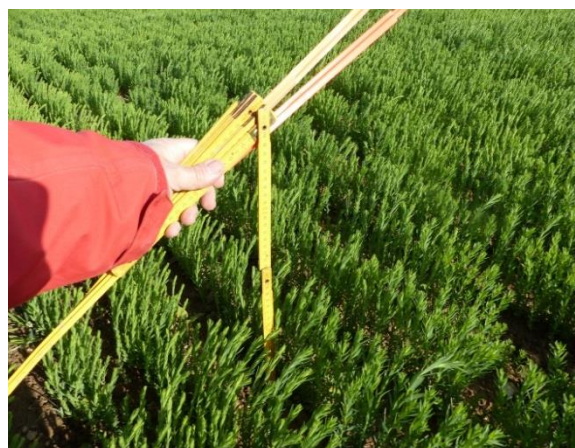
Photo : François D'HUBERT – CA 76 : Parcelle de lin à 18 cm à Illois (76)