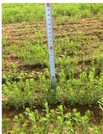
Photo : Vincent Delouye – NATUP : Parcelle avec de la double levée dans l'Eure (27)