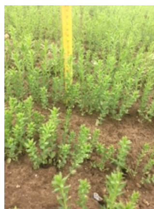
Photo : Hervé GEORGES – CA 80 : Parcelle de lin à 8 cm dans la Somme (80)