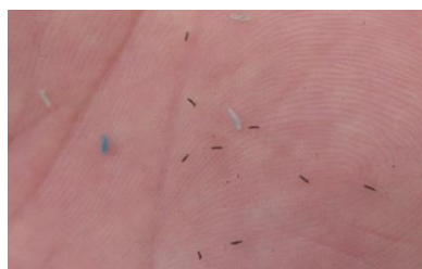
thrips recueillis par balayage du couvert : le seuil est ici dépassé (+ de 5 insectes).

Fin de période dans la majorité des linières. Surveiller les parcelles semées en avril et celles à double levée.