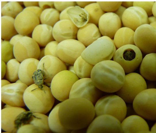
Bruches du pois

Toutes les parcelles de pois sont entrées dans la période de risque, avec des conditions météorologiques redevenant favorables à la maladie. La surveillance des parcelles s'impose.