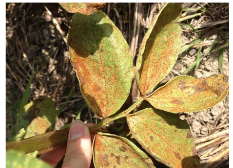
Rouille sur féverole Uromyces fabae.

Seuil indicatif de risque : dès l'apparition des premières pustules de rouille.