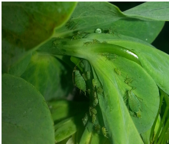
Pucerons verts sur pois

Les parcelles du réseau sont toutes entrées dans la période de risque, et toutes signalent la présence de pucerons verts. Pour 4 parcelles sur 5, l'intensité reste faible avec moins de 10 pucerons par plante. Seule une parcelle de pois d'hiver dans le Tarn fait état d'une pression forte du ravageur (plus de 40 pucerons par plante).