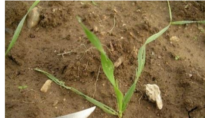
Plantules effilochées par les limaces

Les semis précoces entraînent une plus forte concomitance entre la période de sensibilité de la céréale et la période d'activité des cicadelles. Les parcelles avec des repousses et des graminées sauvages sont également des réservoirs à virus. Un automne doux favorise l'activité de ce ravageur.