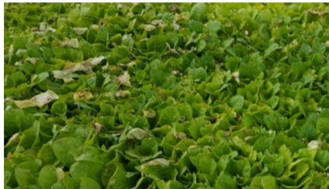
Plants atteints d'Olpidium