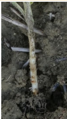
Dégâts de taupins sur plant de tabac

La présence de taupins a été signalée mais sur des secteurs qui restent limités. Les dégâts qui y sont liés restent faibles.