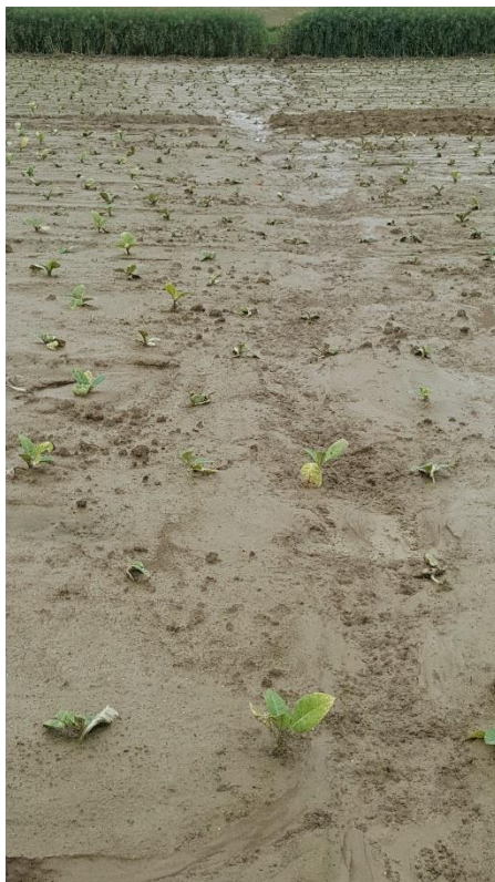
Parcelle de tabac ravinée

Ces conditions climatiques ont retardé certaines plantations, favoriser le développement d'adventices car les binages sont impossibles. Certaines parcelles plantées sont en excès d'eau ou ravinées. C'est le cas de celles de Saussens (31). Les fortes quantités d'eau ainsi que la grêle ont également, plus ou moins, impacté la zone de Saintes (17) où la aussi tout travail a été empêché.