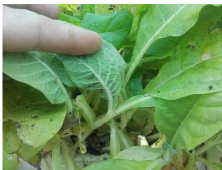
Présence de pucerons sur plants de tabac

Des traces de pucerons sont observées sur les parcelles, en tour de plaine, des zones de Pujo (65), Vivonne (86) et de La Fouillade (12).