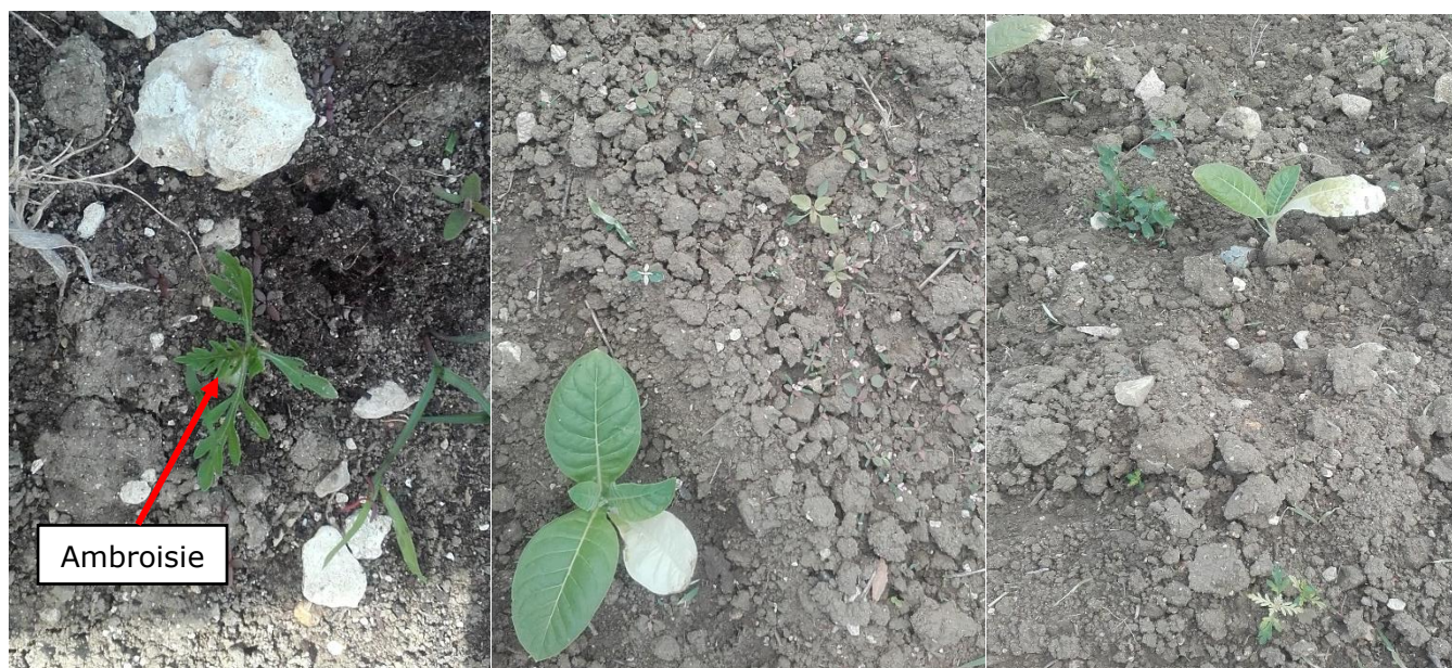
Ambroisie (photo de gauche), Amaranthe (photo du milieu), renouées et liserons (photos de droite) dans champ de tabac

La présence d'autres graminées sur le secteur d'Amuré et de Vivonne ainsi que d'autres dicotylédones sur celui de Vivonne (86) a été signalée.