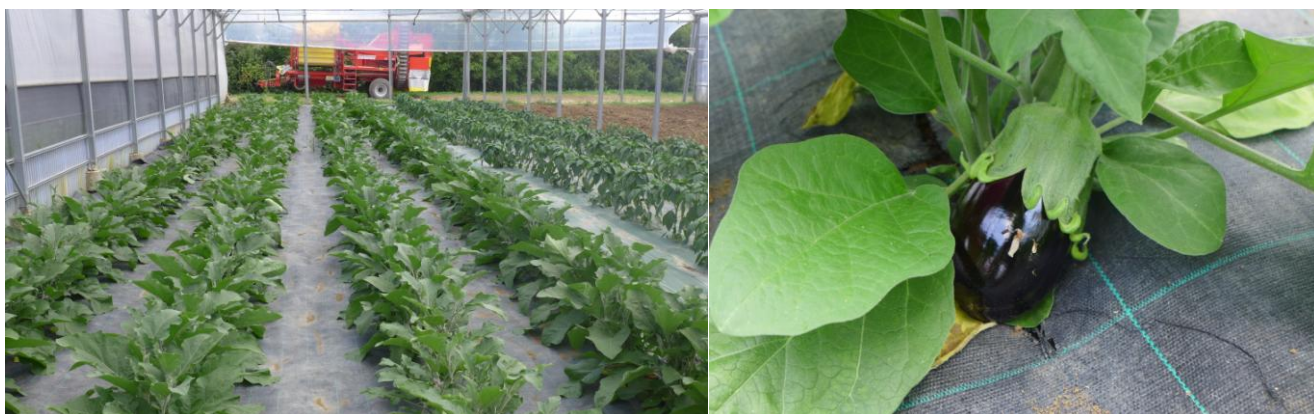
Aubergines, le 07/06 (GY, A. Ney)

Réseau : 5 exploitations observées cette semaine à REPPE (90), VALDOIE (90), GY (70), FOUCHERANS (39).