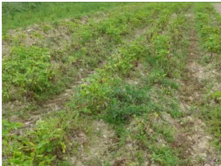
Parcelle AB très atteinte par Phytophthora infestans (Agata), le 28/06/16 (GY, A.NEY)

Principales variétés résistantes : Allians, Naturella, Eden