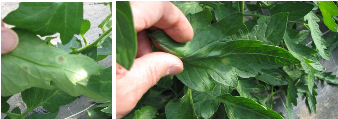
Cladosporiose sur tomate, le 26/06/16

Les conditions chaudes humides ont été propices à l'apparition de cladosporioses sur tomate. On peut observer des départs de symptômes.