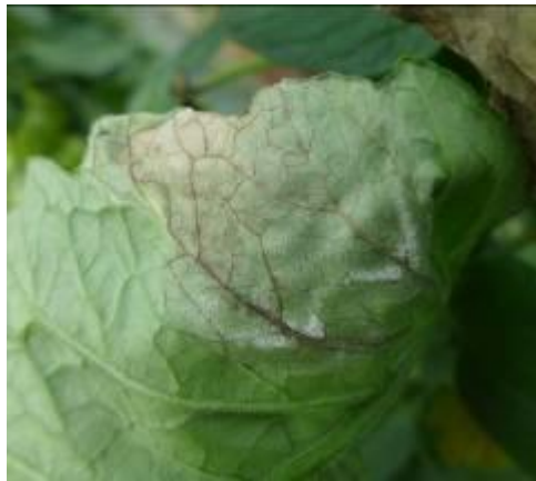
Mildiou dans un tunnel (variétés Amerigo, Maestria) le 28/06 (GY, A. NEY)