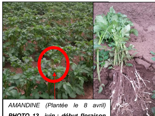
AMANDINE (Plantée le 8 avril) PHOTO 13 juin : début floraison (Gitep)