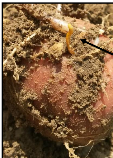
Larve de taupin entrain de creuser une galerie sur tubercule