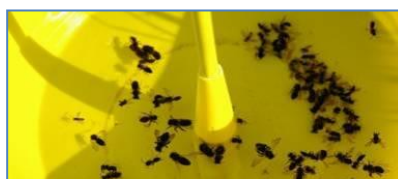
Cuvette jaune

Les pièges ont été installés respectivement les 4 et 17 mai derniers, sur deux parcelles de pomme de terre situées à Marcelcave (80) et à Marchais (02),