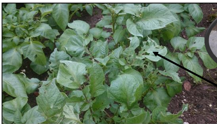
Dégâts de limaces