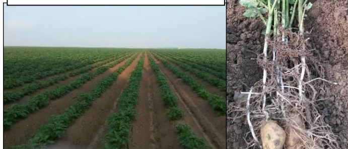
AMANDINE (Plantée le 8 avril) PHOTO 7 juin : Pousse active

Les températures proches de 18°C associées aux pluies favorisent le développement végétatif ainsi que le mildiou. Les parcelles évoluent rapidement ces derniers jours, certaines ont déjà initié leur floraison (cf photos ci-dessous) alors que d'autres sont toujours en pousse active.