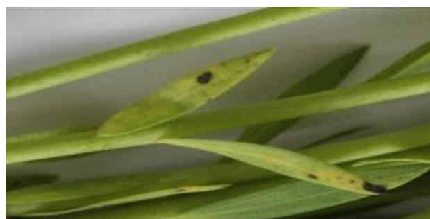
Septoriose sur feuille de lin début floraison (BBCH 61)

Les conditions actuelles sont favorables à la septoriose, maladie qui se développe en général en fin de cycle de végétation. Il convient de surveiller l'apparition de symptômes éventuels (taches nécrotiques rondes noires).