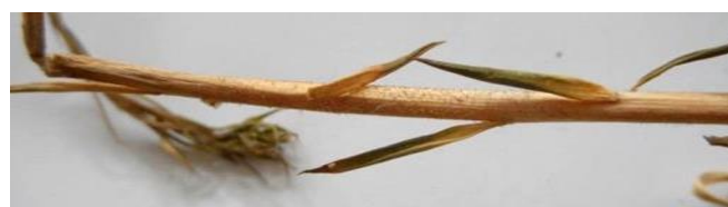
Photo : Botrytis sur tige

Bulletin édité sur la base des observations réalisées par les partenaires du réseau :