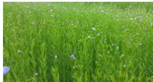
Photo : Lin en pleine pousse au stade pleine floraison - BBCH69 (D.CAST - ARVALIS)

De plus, des averses de grêles ont également causé des dégâts dans certaines linières