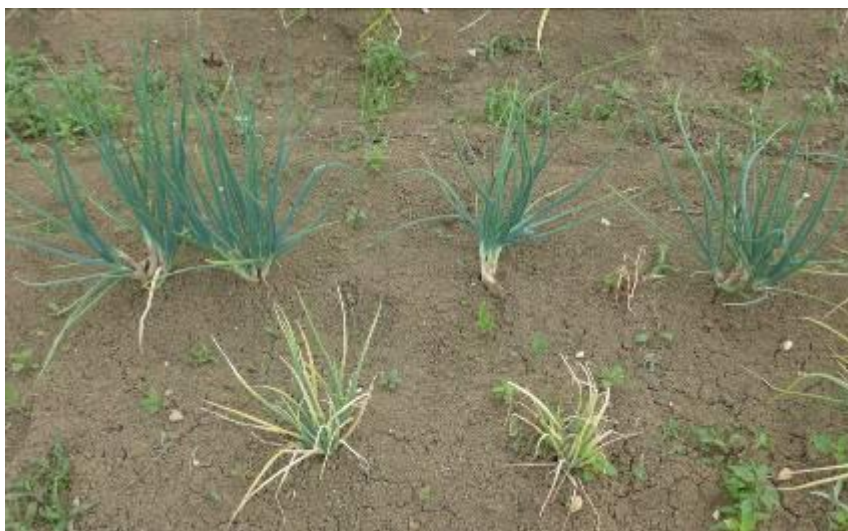
Pourritures sur échalotes, les 6 et 7/06/16 (Reppe et Gy)