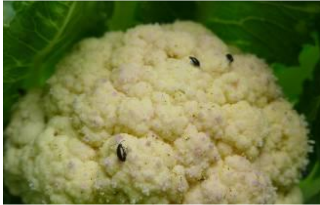
Altises sur chou-fleur, le 8/06/16 (Gy, A. Ney)

Des altises sont présentes sur l'ensemble des parcelles à des degrés divers. A surveiller.