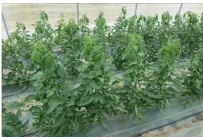
Tomates sous abris, les 6 et 7/06/16 (Reppe et Gy)