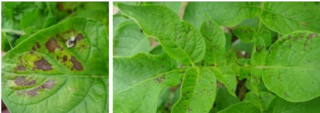
Symptômes d'alternariose sur Agata en AB le 7/06/16 (GY, A.Ney)