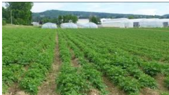
Parcelles de Pomme de terre, le 7/06/16 (Franois et Gy, A.Ney)