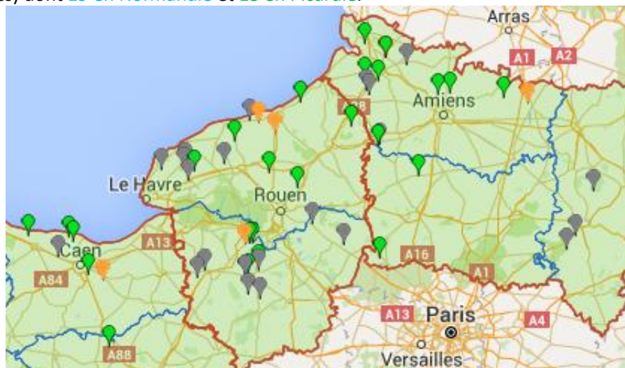
Points gris : parcelles non renseignées cette semaine. Points Verts : stade 10 cm au stade 80cm. Points oranges : stade boutons floraux visibles.

Cette semaine, les observations ont été réalisées dans 32 parcelles fixes (points blancs) dont 19 en Normandie et 13 en Picardie .