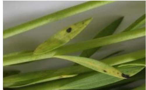
Photo : Septoriose sur feuille de lin début floraison (BBCH 61) D.CAST (ARVALIS)

Les conditions actuelles sont favorables à la septoriose, maladie qui se développe en général en fin de cycle de végétation. Il convient de surveiller l'apparition de symptômes éventuels.