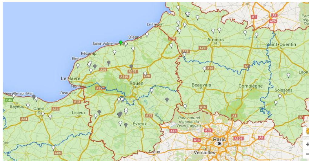
Points gris : parcelles non renseignées cette semaine.

Cette semaine, les observations ont été réalisées dans 34 parcelles fixes (points blancs) dont 26 en Normandie et 18 en Picardie .