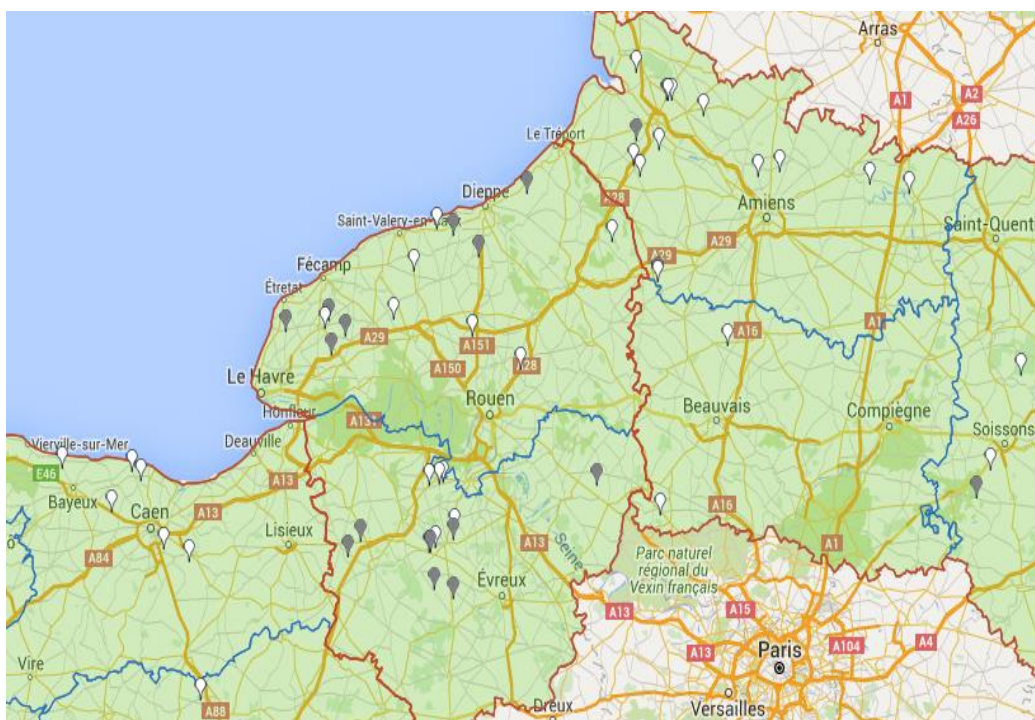
Points gris : parcelles non renseignées cette semaine.

Cette semaine, les observations ont été réalisées dans 34 parcelles fixes (points blancs) dont 19 en Normandie et 15 en Picardie .