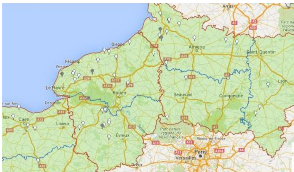
Points gris : parcelles non renseignées cette semaine. Source Vigicultures.

Cette semaine, les observations ont été réalisées dans 30 parcelles fixes (points blancs) dont 16 parcelles en Normandie et 14 parcelles en Picardie .