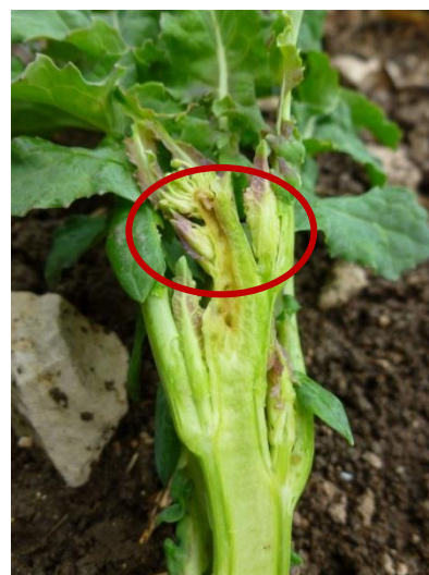
Photo : larves d'altise dans le cœur de la tige

Les premiers dégâts dans le cœur des plantes sont observés sur une parcelle (Condé en brie, 02, cf. photo) sur 15% des plantes. La pénétration des larves dans le cœur de la plante provoque un port buissonnant et peut donc être très préjudiciable pour le développement de la plante. Cette évolution est à surveiller dans les parcelles avec forte présence de larves dans les pétioles des feuilles.