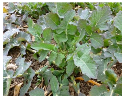
Colza au stade D

Les stades avancés pour la saison progressent lentement malgré la hausse des températures cette semaine. L'hétérogénéité perdure. L'alternance des périodes de froid et de redoux aboutit à une croissance à rythme saccadé.