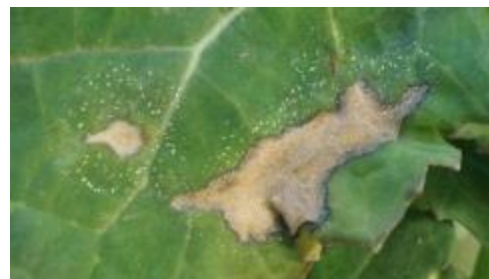
Photo : cylindrosporiose sur feuille

Les colzas sont globalement peu touchés par les maladies.