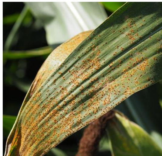
Puccinia sorghi

Les conditions climatiques actuelles (températures douces, humidité) sont plutôt favorables à la maladie.